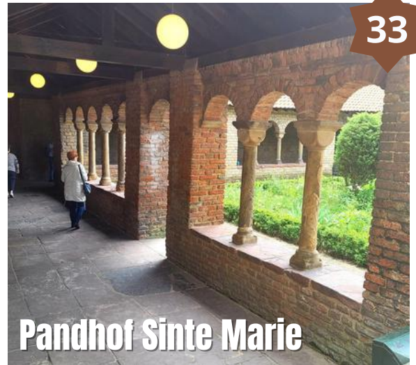
Pandhof Sinte Marie

Tussen de gebouwen van het conservatorium ligt de pandhof van de voormalige Mariakerk. De 11e eeuwse Mariakerk was één van de vijf Utrechtse kapittelkerken, en behoorde tot de meest indrukwekkende Romaanse gebouwen van Nederland. Tijdens het beleg van kasteel Vredenburg 1576 begint echter de aftakeling, en vanwege de opheffing van het kapittel in 1811 wordt de kerk uiteindelijk in etappes gesloopt. Vandaag de dag staat alleen de kloostergang nog overeind. De hof of open ruimte wordt samen met de omliggende panden van de 11e eeuwse kloostergang aangeduid met de naam Pandhof Sinte Marie. In de schitterende tuin ligt een fraaie bloemen-, kruiden- en vlindertuin.