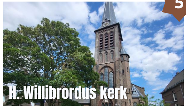
H. Willibrordus kerk