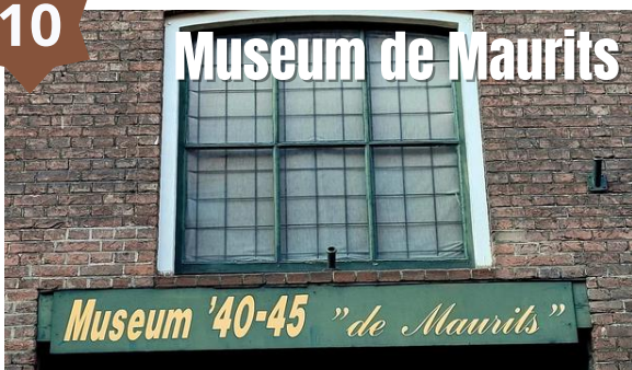
Museum de Maurits