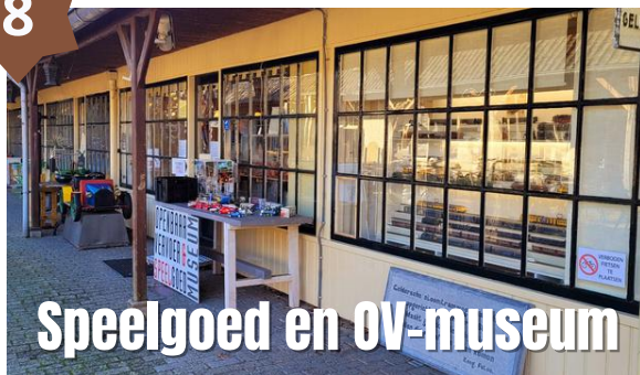
Speelgoed en OV-museum

Het Speelgoed en OV-museum aan het Gildehofje toont de geschiedenis van het openbaar vervoer in Nederland en in het bijzonder die van de Gelderse Tramwegen in de Achterhoek. Aan de hand van oude gebruiksvoorwerpen, foto's en prachtige schaalmodellen van oude treinen en bussen krijg je een goed beeld van het openbaar vervoer uit het verleden.