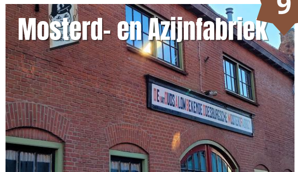
Mosterd- en Azijnfabriek