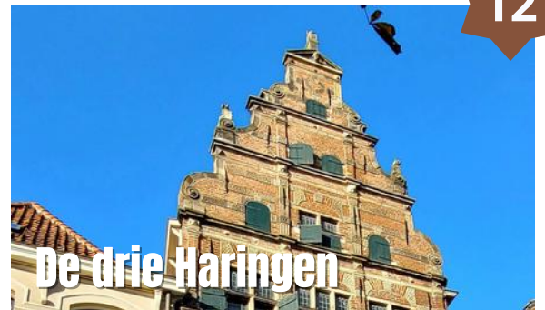
De drie Haringen