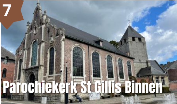
Parochiekerk St Gillis Binnen

De parochiekerk Sint-Gillis-Binnen bevindt zich binnen de oude stad van Dendermonde. De toevoeging "binnen" kwam toen de stad uitbreidde en er ook parochie Sint-Gillis-Buiten ontstond. Het kerkje heeft staat op de plaats van de oudste nederzetting en heeft een barokke gevel. De kerk is elke morgen open van 9.30 - 12.00 uur.