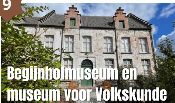
Begijnhofmuseum en museum voor Volkskunde

In het begijnhofmuseum en museum voor Volkskunde maak je kennis met het leven van alledag, zoals dat zich in de negentiende en begin van de twintigste eeuw hier afspeelde: het huishouden, de behuizing, het werk, de ontspanning. Kortom het leven zelf. In begijnwoningen nummer 11 en nummer 25 werden kamers gereconstrueerd en in nummer 25 werd in de overblijvende kamers het Museum voor Volkskunde geopend. Later werd het museum verder uitgebreid met nummer 24, de infirmerie uit 1709.