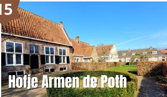
Hofje Armen de Poth

Het Hofje Armen de Poth is het enige hofje van Amersfoort en een oase van rust. De huidige 48 huisjes worden allen bewoond, behalve één die dienstdoet als 'toonhuisje' en schaftruimte. Bij elke van de drie poorten die toegang geven tot het complex vind je een plattegrond of stoepstenen die verwijzen naar de website of de app voor een digitale rondleiding.